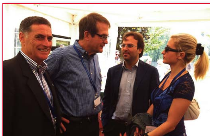
Torino, 21-22 giugno 2011; nella foto in alto: i rappresentanti sindacali Fiat e Chrysler con la delegazione americana capitanata da Bob King (nella foto sopra tra Rocco Palombella, Gianluca Ficco e Chiara Romanazzi) davanti alla sede dell'Ilo Center

Fism che ha coordinato i lavori in questa occasione, "il 21 e il 22 giugno di quest'anno abbiamo posto la pietra miliare per la collaborazione internazionale della rete Fiat". Lo stesso esperimento è stato effettuato, sempre insieme ai sin-